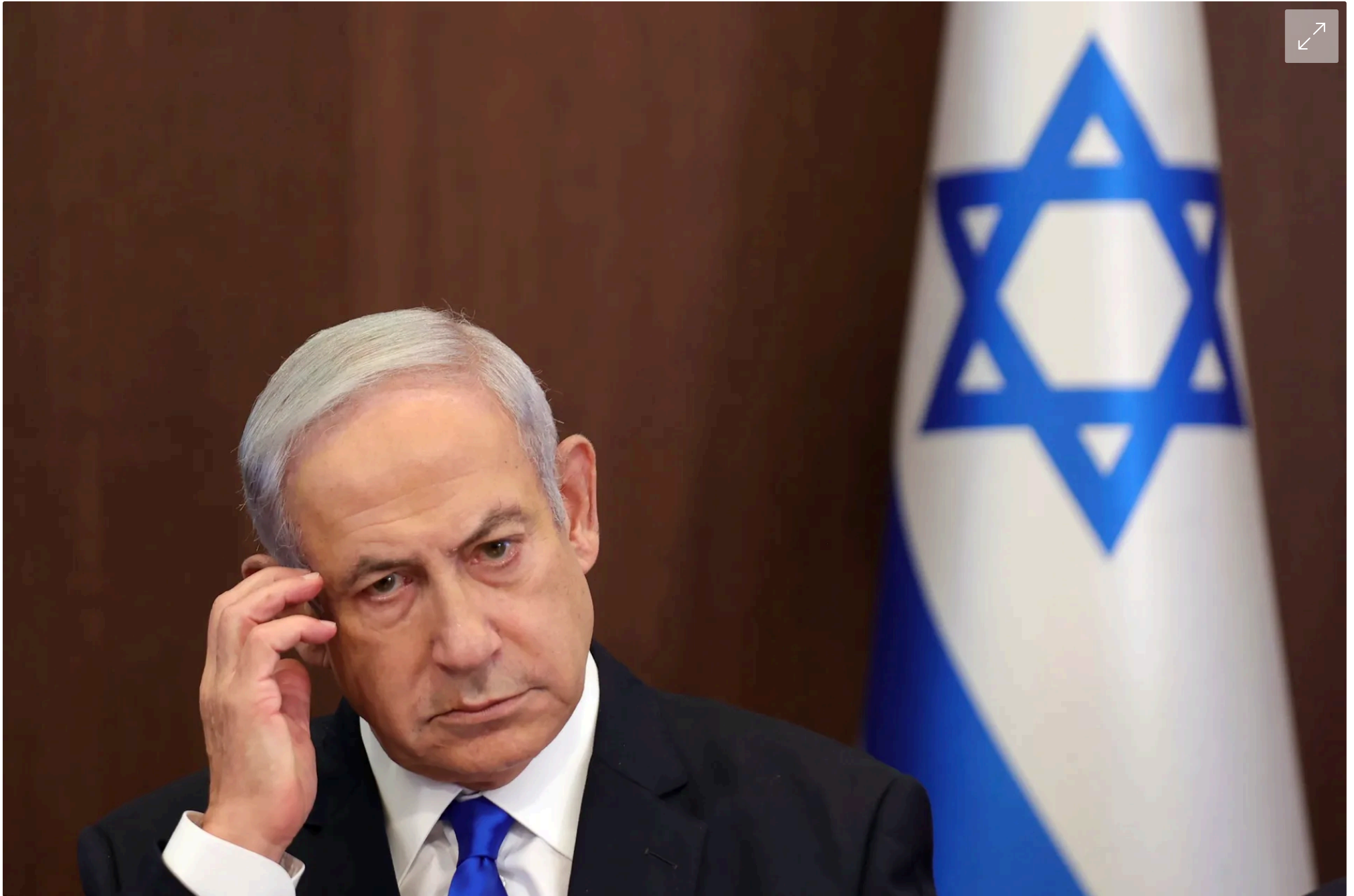
Israels Premier Benjamin Netanyahu: Wollte Extremist als Direktor von Yad Vashem